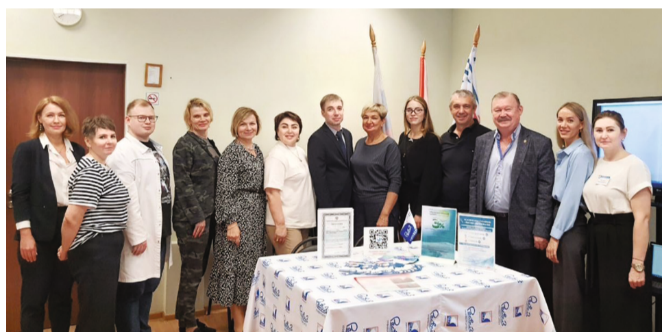
Сотрудники приемной комиссии Университета «Реавиз» в г. Санкт-Петербурге

Кроме того, мы всегда идем навстречу и стараемся помогать и тем, кто усерден и показывает хорошие результаты в