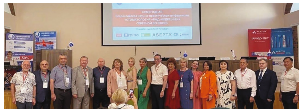
Организаторы, руководители секций и члены жюри конференции