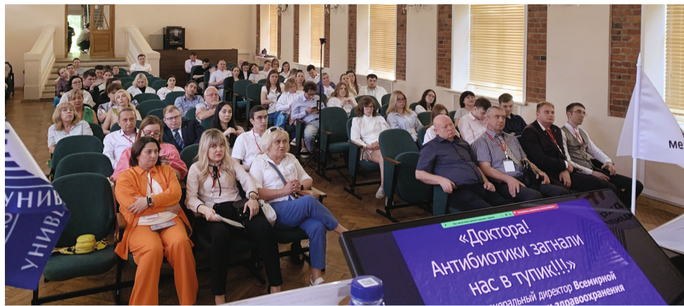
Цандеровский зал собрал около двухсот участников

В Санкт-Петербурге 31 мая состоялась II-я Ежегодная Всероссийская научно-практическая конференция «Стоматология «РЖД-медицины» Северной Венеции»