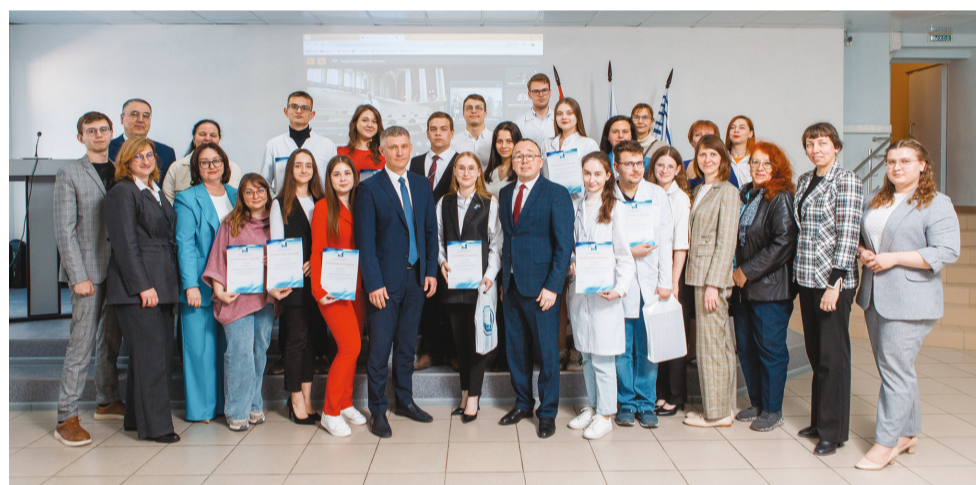
Награждение победителей конференции «Научная весна–2024»

В Медицинском университете «Реавиз» состоялась I Всероссийская научно-практическая конференция студентов и молодых ученых с международным участием «Научная весна–2024», собравшая студентов, ординаторов, аспирантов и молодых ученых-врачей.